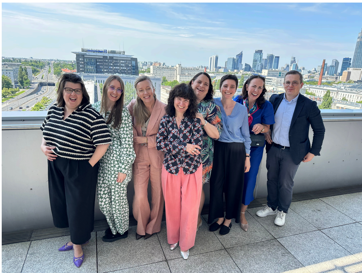
Zespół i Zarząd Forum Darczyńców