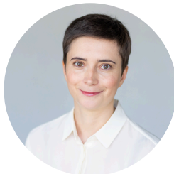
Ekspertka ds. rzecznictwa i działalności edukacyjnej