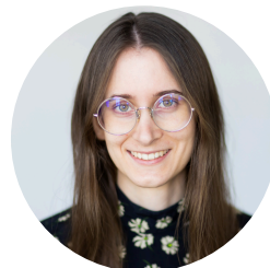
Koordynatorka ds. komunikacji i klimatu