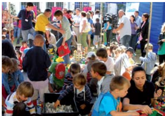
Festiwal Singera, Warszawa 2009 – Budujemy sztetl z klocków lego

Publikacja przygotowana w ramach stypendium Dialog Międzykulturowy 2008, ma na celu wprowadzenie niemieckiego czytelnika w skomplikowaną materię stosunków między Polakami a Żydami. Opracowanie wychodzi z założenia, że pojęcie ich istoty jest nieodzowne dla zrozumienia procesu przemian wzorca społecznego i jego znaczenia dla polskiego dyskursu tożsamościowego, jaki w ostatnich latach daje się zaobserwować w Polsce.