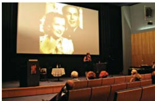
Wieczór twórczości Jana Kiepury

panelowe i prezentacje książek. Program ten został zorganizowany i sfinansowany przez Niemieckie Muzeum Historyczne i FWP.