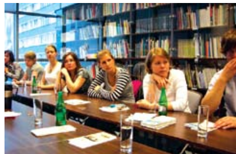
Stypendyści GFPS w siedzibie FWPN

Tradycją stały się spotkania organizowane przez FWPN w Warszawie dla byłych i obecnych stypendystów GFPS. W roku 2009 odbyły się dwa spotkania, w maju i w grudniu, podczas których uczestnicy zapoznali się z działalnością Fundacji. FWPN zaoferowała również program kulturalny, w tym zwiedzanie Warszawy, spektakle w Teatrze Capitol, koncert Chopinowski w parku Łazienki Królewskie, zwiedzanie Muzeum Powstania Warszawskiego.